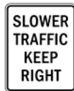
低速車は右車線走行を維持せよ