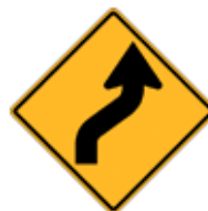
この先、(→右→左)逆カーブあり